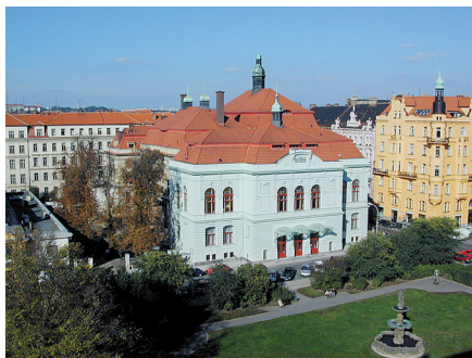
Národní dům na Smíchově

JIŽ DNES SI RESERVUJTE 11.- 13. LISTOPAD 2005 VYUŽIJTE MOŽNOSTI KOMUNIKACE S PŘEDNÍMI ALPINISTICKÝMI OSOBNOSTMI Z ČR A ZE ZAHRANIČÍ