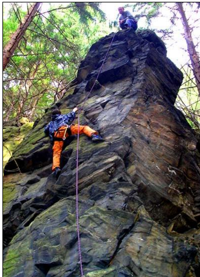
(Jiří Opiel leze Velrybářskou IV na Žraloka. Jistí autor.)

(Na snímku prvovýstup Black Velvet VI na masív vlevo od Žraloka)