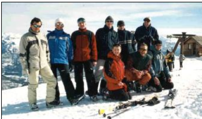
Naše partička v Puy Saint Vincent, únor 2004

Cesta zpět byla o to smutnější, že člověk ví o dalších 17 hodinách své a krom toho opouští místo, které bylo týden jeho učiněným lyžařským rájem. Všechno jednou končí. Každopádně obě cesty šly přežít a hlavně nebyly poznamenány žádnou nehodou. Dorazili jsme zdraví a plni zážitků. Není čeho litovat, jen se těšit na další rok.